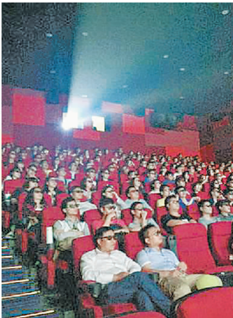
现在看一场3D电影已是平常事。