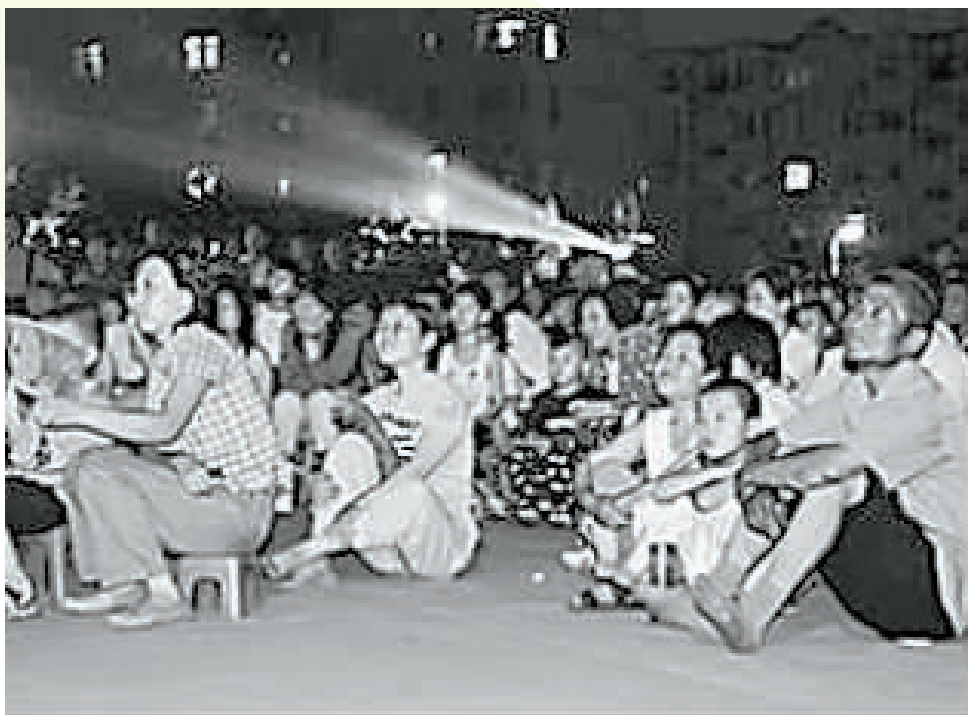
家家户户吃过饭后自带小板凳去看电影。

钱,不再为吃穿犯愁,家里有一台彩电的愿望才得以实现。记得把电视抬回家后,我们一家人都跟过节一样,炫耀地对别人说,我们家也有了彩电。后来家里有了电脑,我们更是到处炫耀。再后来,有了电脑和智能手机,可以在网上随心所欲地搜喜欢的电影看,但我依旧对露天电影情有独钟。每次操场放电影,我们一家还是会去看,尽管看露天电影的人越来越少。