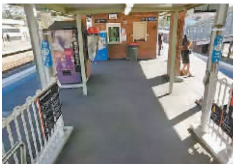
小镇的火车站可以随意出入。

然后开了张罚单,好像是二百多澳元。那个女孩心里肯定也不好受,车一停站就匆匆地走了。我都有点替她难过,车票最多不到十澳元,她这是何苦呢?