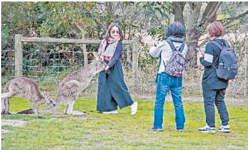
人和动物和谐相处。