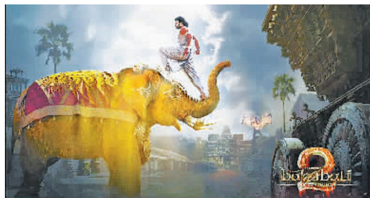
《巴霍巴利王》电影海报。

近年来,在不经意间印度电影悄然咸鱼翻身,《未知死亡》《三傻大闹宝莱坞》《摔跤吧!爸爸》《小萝莉的猴神大叔》等佳作不断涌现,这类电影故事深刻,剧情引人入胜,更多取自于现实题材,正是所谓“宝莱坞电影”。还有一类“南印度电影”,这类电影往往场面宏大、歌舞丰富、脑洞大开,《巴霍巴利王》系列就是典型的代表作。