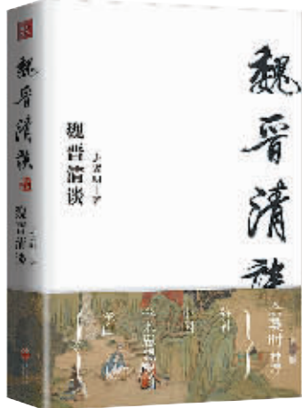
唐翼明 著 天地出版社 2018 年 8 月第 1 版 定价:58.00 元

唐翼明出身文化名门,家学甚严,学术专长为魏晋文学与魏晋思潮,著作甚丰。《魏晋清谈》作为他的代表性学术作品,是他花费数载时光研究撰写的一部专著。作者对于这一专题在现代的研究状态,包括中国的、日本的和西方的,作了一番通盘的检查。他很惊奇地发现,尽管现代研究者涉及这一题旨的文献汗牛充栋,但是我们还是没有一部专书全面地论述“魏晋清谈”的形成和演变,本书将填补中国学术思想史上这一空白。