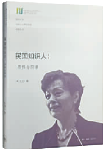
叶文心 著 生活 读书 新知三联书店 2015 年 8 月第 1 版 定价:30.00 元