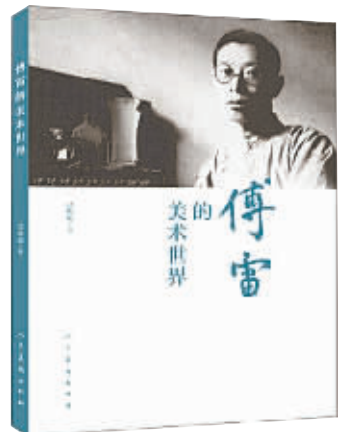
吕作用 著 人民美术出版社 2018 年 6 月第 1 版 定价:38.00 元