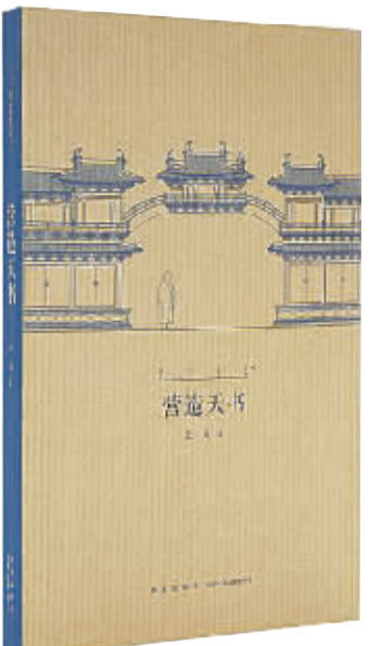
王南 著 新星出版社 2016 年 12 月第 1 版 定价:28.00 元

们特许我从“征订书目”上挑书,唯一的要求是每种征订数不能少于两本。我还脸皮厚,试探过新书到后只肯买走一本,剩一本要么长期闲置要么请他们配送给图书馆之后,屡试不爽。