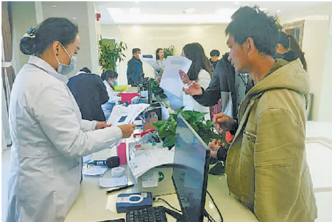
至少4个人随时候命的前台。