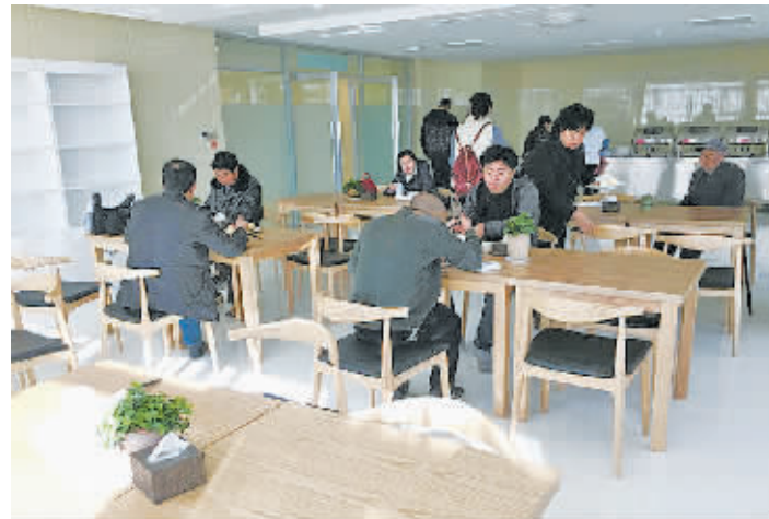
就餐区环境舒适,早餐丰盛。

“在这个拼服务、重体验的时代,作为西昌医疗卫生事业的“领头羊”,西昌市人民医院一直以来,以医疗质量持续改进为核心,不断优化服务流程,持续提高患者的就诊体验。继胸痛中心成功创建、首都医科大学宣武医院疼痛诊疗中心落户、四川省新生儿听力障碍诊治凉山分中心成功创建、医院开扩建项目顺利动工之后,历时一年投入5000万元全新打造的西昌市人民医院健康管理中心于2018年11月27日开始试运行。