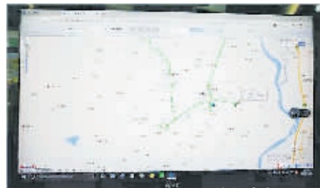
后台显示的行车轨迹。

如何及时发现公车并有效杜绝公车违规?今年5月,西昌市纪委分三步走为全市公车装配了GPS定位系统,建立了车辆行驶轨迹回放、车辆报警、信息查