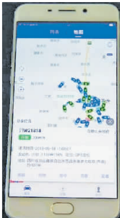
手机实时监控公车使用轨迹。

理统一标识化之后西昌市的又一有力举措。”市纪委监委方浩说道。5月18日,在市纪委党风政风监督室电脑屏幕前,工作人员点点鼠标,屏幕上出现市林业局一辆公务用车早晨从单位出发,去往琅环乡桃园村的行车轨迹。