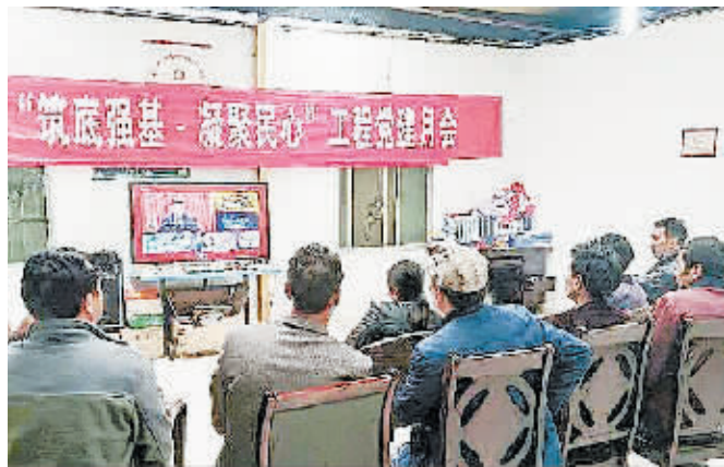
响水乡的干部群众积极参加村党建月会。

响水乡近年来在脱贫攻坚的道路上,按照“一个产业,一套领导班子,一笔工作经费,一份责任书”的要求,打破以往传统种植羊芋等低附加值的作物,以调整结构为主线,增加农民收入为目标,在全乡广泛开展“一乡一业,一村一品”活动,成立清香型烤烟、高产优质马铃薯种植工作领导小组,加快培植烤烟、马铃薯产业。全乡和彝鸿公司深入推进核桃的种植特色产业,加大种植面积和规模,在新种植高产优质核桃嫁接苗16万株的基础上,又新种植2.3万株,引进盐源大核桃1000棵。目前已形成了以种